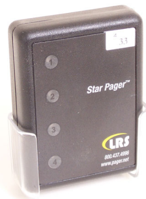
Pager service dans son support amovible avec clip ceinture

Mode alerte programmable à partir de l'émetteur : vibrant et/ou sonore. Nombre de vibrations 1, 2 ou 3 en fonction du lieu d'appel