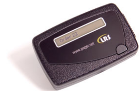
RX-SP5 : Bipeur alpha 1 ligne

La société LRS France – StarPager est le distributeur exclusif des produits LRS "Long Range Systems, Inc." en France.