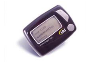
RX-E446 : Bipeur alpha 4 lignes