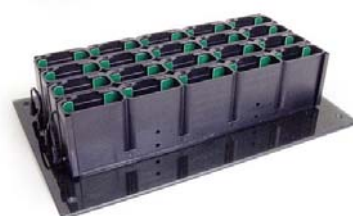
Chargeur 20 bipeurs

Les bipeurs rechargeables fonctionnent avec des batteries NiMH . De technologie plus récente que les batteries NiCd, elles n'ont pas d'effet mémoire, ce qui permet une recharge optimale (durée de vie : 3 à 5 ans).